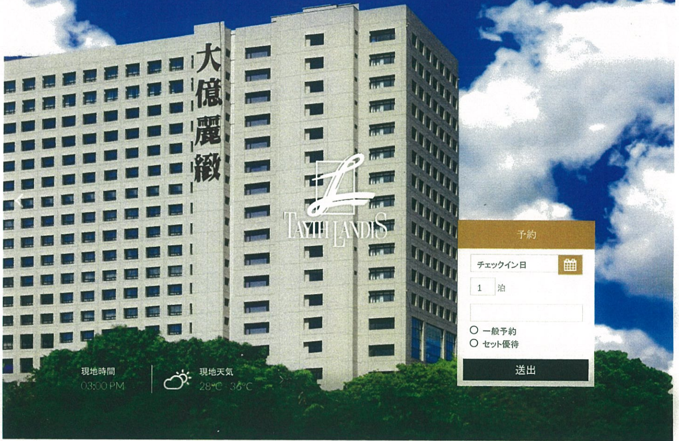
台南大億麗緻酒店